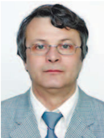
Директор ИФТТ чл.-корр. РАН В.В. Кведер