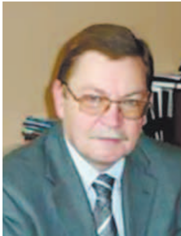
Директор ИФАВ чл.-корр. РАН С.О. Бачурин