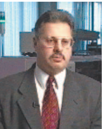
Директор ЭЗАН чл.-корр. РАН В.А. Бородин