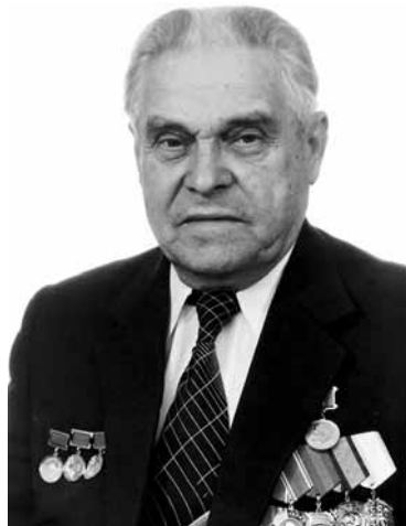
Чл.-корр. РАН Ф.И. Дубовицкий