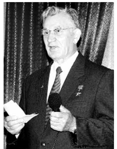
Чл.-корр. РАН И.В. Мартынов