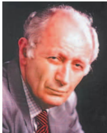
Академик Ю.А. Осипьян