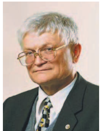
Академик Н.С. Зефирова