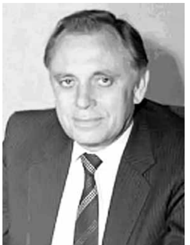
Чл.-корр. АН СССР Ч.В. Копецкий