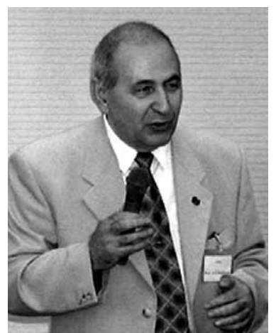
Академик А.Г. Мержанов