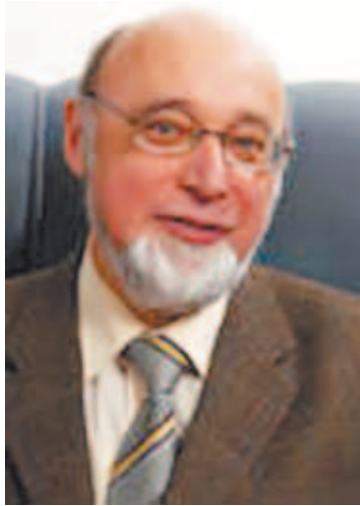
Директор ИПХФ академик С.М. Алдошин