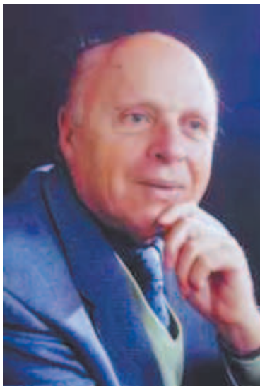
Академик И.М. Халатников